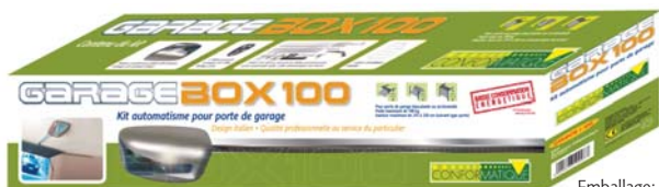
Emballage: boîte en carton 94x16x23 cm poids: 14 kg