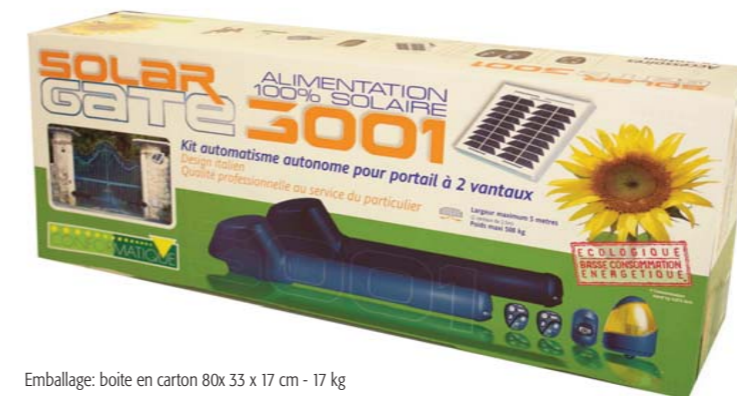
Emballage: boîte en carton 80x 33 x 17 cm - 17 kg